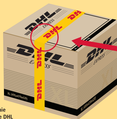
Opakowanie kartonowe DHL