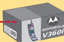
Pudełko oryginalne lub zastępcze